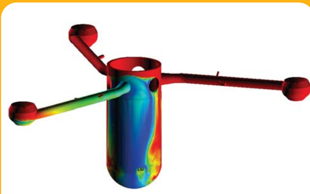
Simulation d'une cuve réacteur nucléaire (EDF)